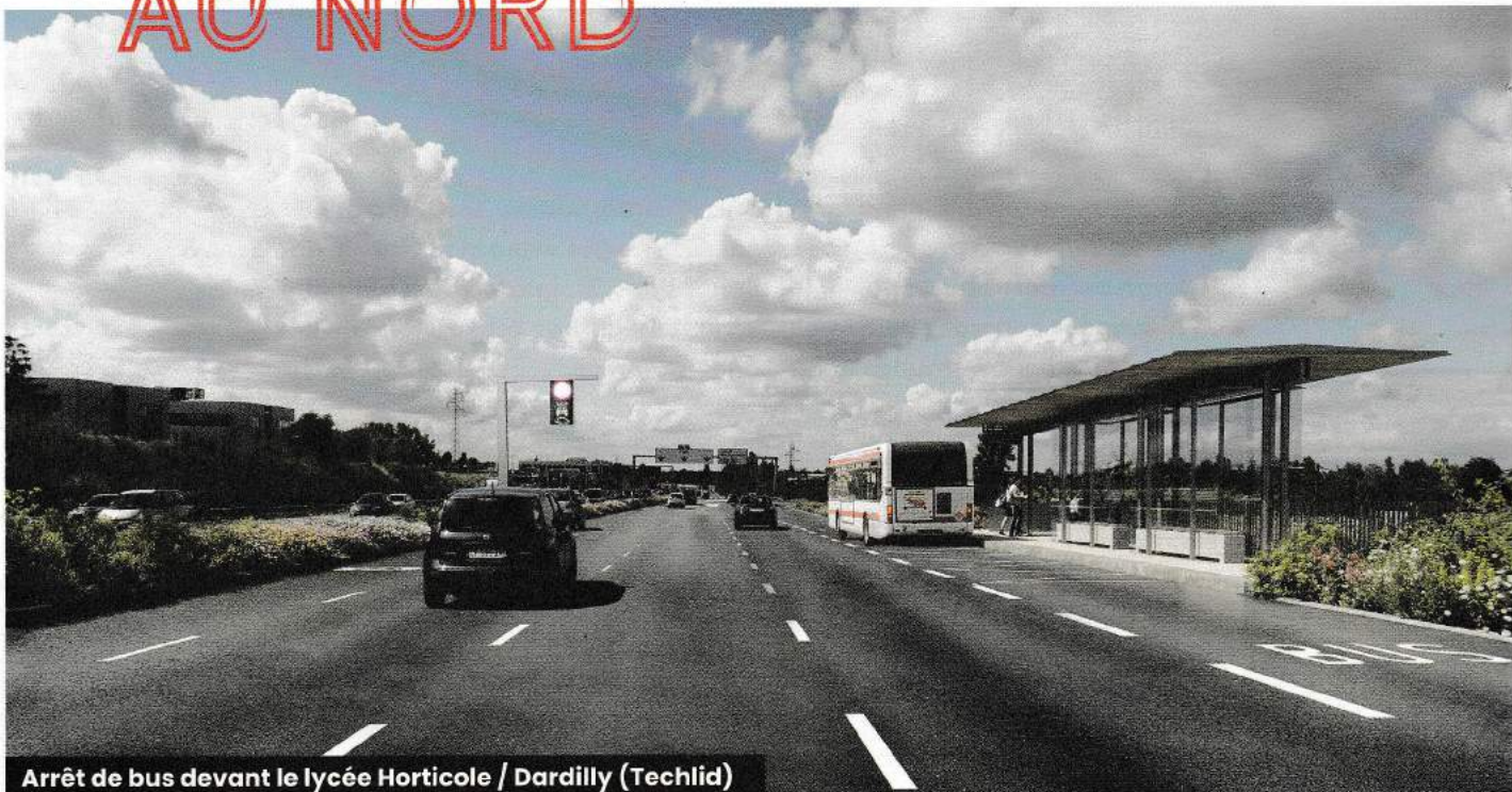
Arrêt de bus devant le lycée Horticole / Dardilly (Techlid)