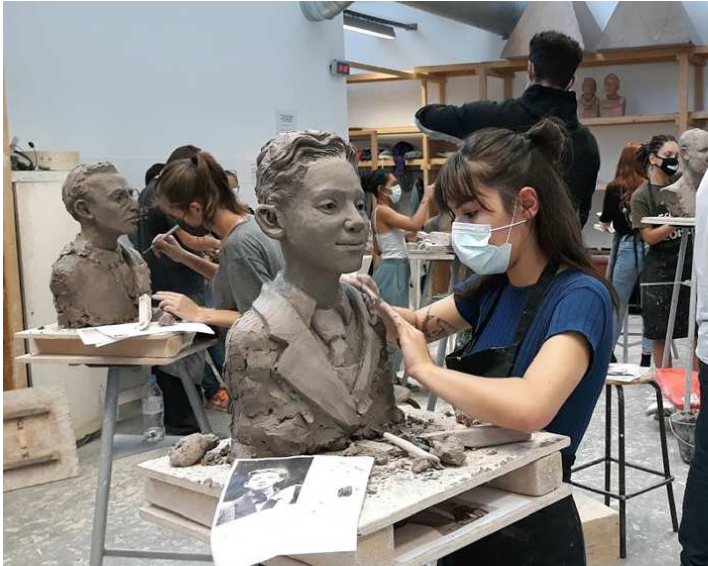
Atelier de Pascal Jacquet et Ugo Panico.