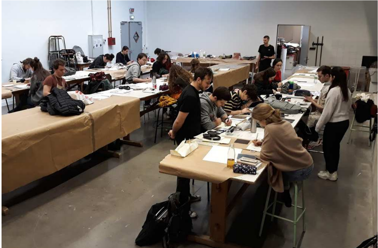
Atelier de gravure de Gilbert Houbre.